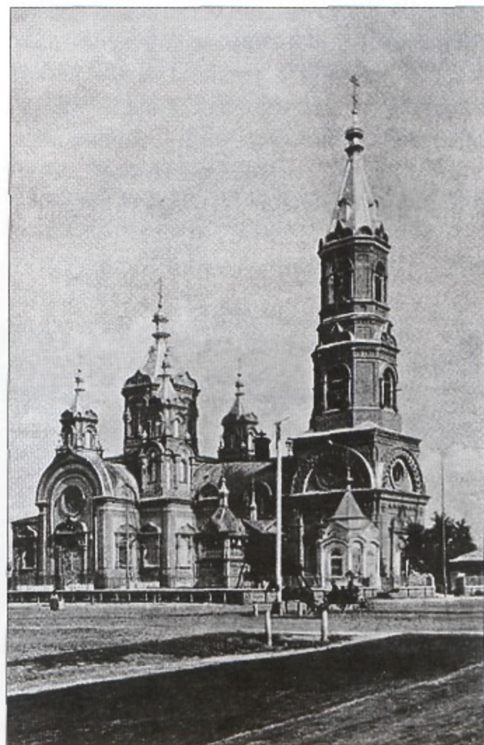
Мелекес. Собор Св. Александра Невского

Пересекаю Хлебную площадь. Здесь ежегодно с 1 по 8 декабря (по старому стилю) проводится знаменитая Всевожская зимняя Никольская ярмарка.