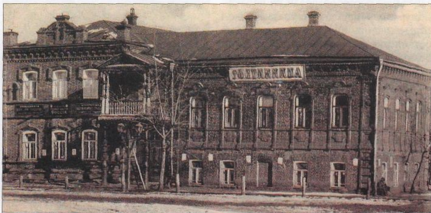
Здание гостиничных номеров Фишера сохранилось до наших дней. Фото начала XX века слева, фото начала XXI века справа

Около здания женской гимназии, выстроенном недавно, в строгом, неоклассическом стиле (архитектор из Симбирска Ф.О. Ливчак), стоит группа гимназисток. Напротив Народного дома, около шикарных гостиничных номеров Фишера (ныне магазин «Фермер») – собралась толпа извозчиков. Они обсуждают последние известия с фронта. К ним направляется